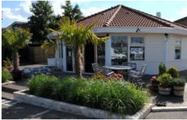
Yacht – Shop Charterbüro und Hafenrestaurant 52° 58. 012'N – 005° 25. 300 E